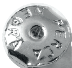
• Tuerkas de aros Acero