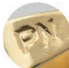
• Terminales de dijes Oro