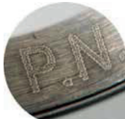
• Interior de anillos Acero