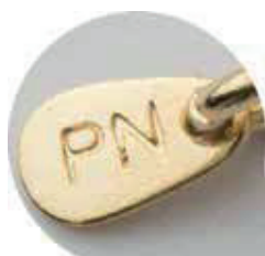
• Cierre Gargantilla, cadenas y pulseras oro