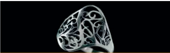
JOYAS DE PLATA 925

Línea Piedras: estos productos son sumamente delicados. En lo que refiere a Semijoyas, tienen garantía total. Lo que no cubre la garantía es la rotura de las piedras. Recomendamos guiar al cliente en el cuidado de las mismas.