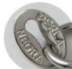
• Pulsera y gargantilla Acero