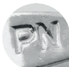
• Terminales de dijes Acero

Para ello hemos desarrollado un sistema donde colocamos nuestra marca en cada pieza de una forma especial e inviolable. Es importante resaltar esta tarea para el cliente, es una forma de cuidar lo que invierte en nuestra marca. Las mismas se encuentran en: