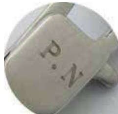
• Eslabón entre cadenas o pulseras