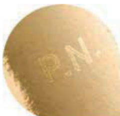
• Interior de anillos Oro