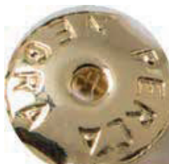
• Tuerkas de aros Oro